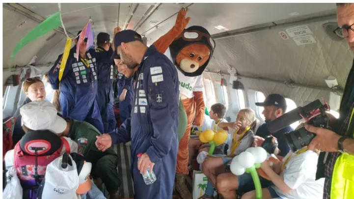
Les enfants ont vécu un moment magique à l'aéroport Orléans Loire Valley.