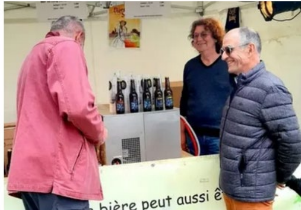
Vendredi, le public a notamment pu déguster quelques bières au stand de la bière sociale.